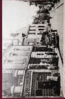
Rue de la fontaine