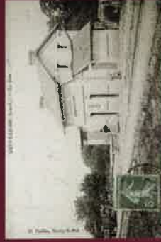
Ancienne gare (privé)