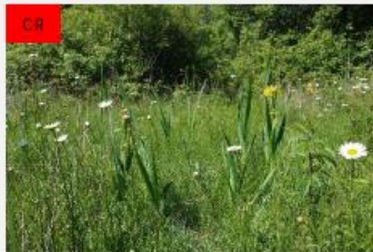
Prairies humides oligotrophes thermophiles sur sol basique

Pour maintenir cette patrimonialité l'entretien par fauche doit persister pour les prairies. De plus, pour préserver les zones oligotrophes toute fertilisation est à proscrire. Les prairies pauvres en nutriments fournissent des foins peu appétant mais riches en oligoéléments. Les prairies méso-hygrophiles peuvent fournir des fourrages de bonne qualité.