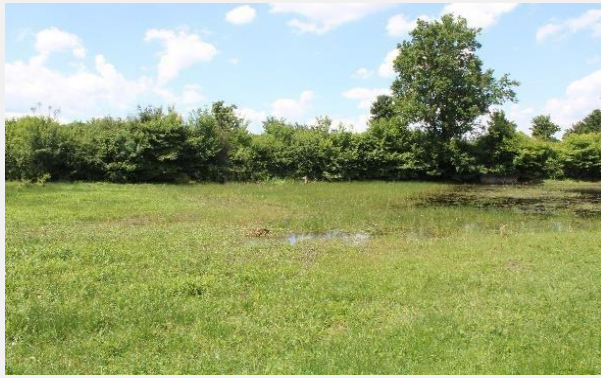
Le site abrite une prairie longuement inondable ainsi qu'un herbier aquatique