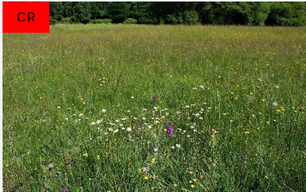
Prairies oligotrophes à mésotrophes hygrophiles