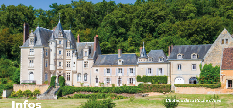
Château de la Roche d'Alès