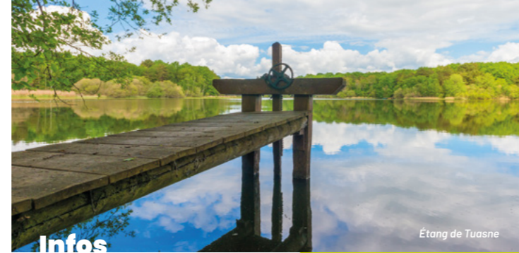
Étang de Tuasne

Chapelle de l'Hôpital Située sur le chemin des croisades menant à Saint-Jacques-de-Compostelle, Saint-Martin de Tours et le Mont-Saint-Michel, elle était sous la dépendance de la commanderie d'Amboise. Dirigée par les Templiers puis par les moines hospitaliers de l'Ordre de Malte, elle est restée un lieu de refuge et d'hospitalité pendant 300 ans. Construite plus récemment, la petite chapelle était un lieu de pèlerinage et de procession jusqu'à la Seconde Guerre Mondiale. Chaque année, de nombreux enfants y étaient guéris de leurs maux et de leurs peurs. Site privé.