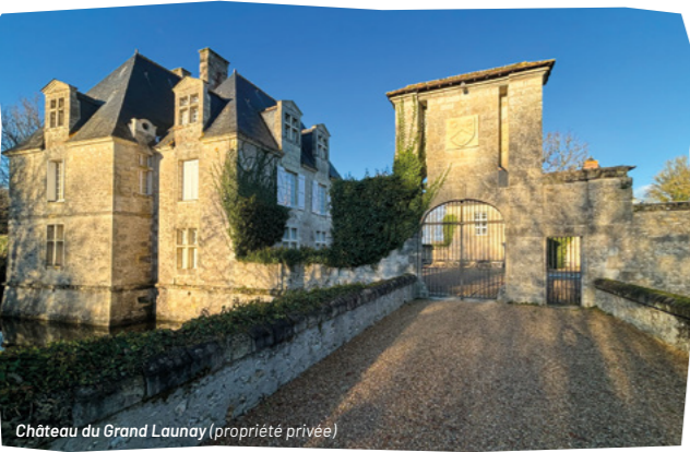
Château du Grand Launay (propriété privée)