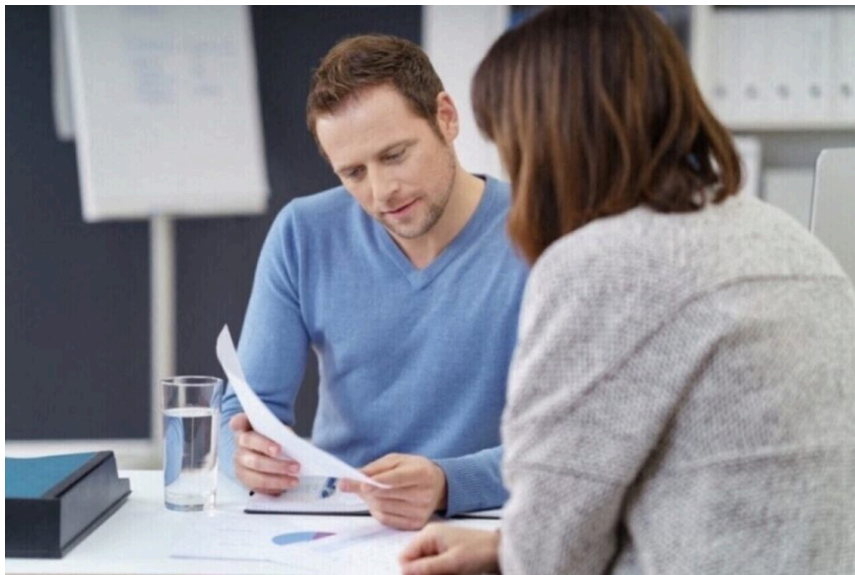
L'événement Job Infos 2026 aura lieu de 9h30 à 13h samedi 30 mai 2026 à Saint-Paterne-Racan (Indre-et-Loire).

Par Lucile Ageron Publié le 26 mai 2026 à 12h20